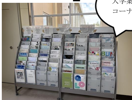
大学案内コーナー